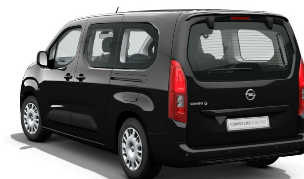
Black Perla Nera